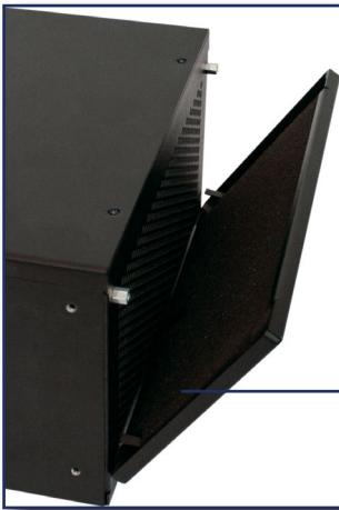
Filterkassette mit Filtermatte

Optional mit Wi-Fi/Bluetooth und GNSS/LTE